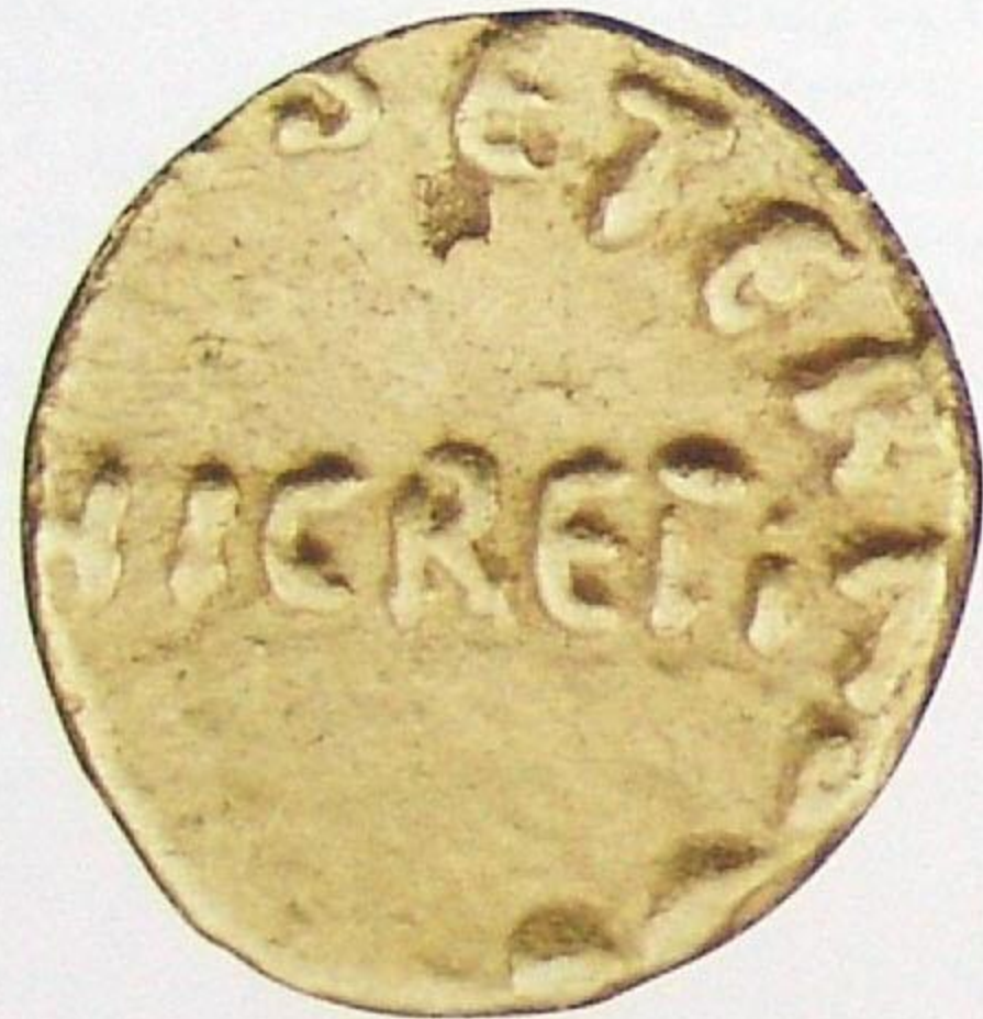
دينار عربي لاتيني شمال أفريقيا سنة: ٨٥ هجري